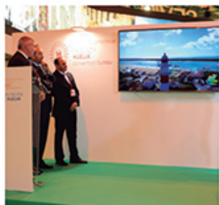
/ Promoción en FITUR que se ha traducido en miles de nuevos turistas.