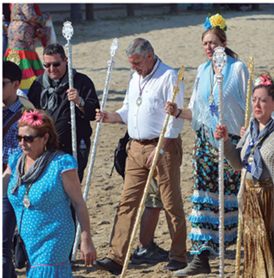
/ Con la Hermandad del Rocío de Cartaya, en unos momentos tan importantes como los que han vivido en los últimos años.