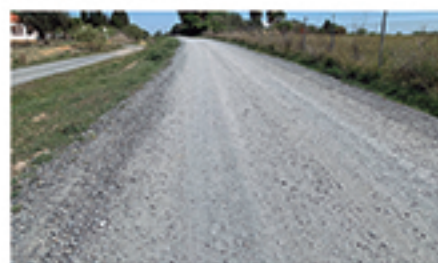
/ CARRIL LOS COCHES