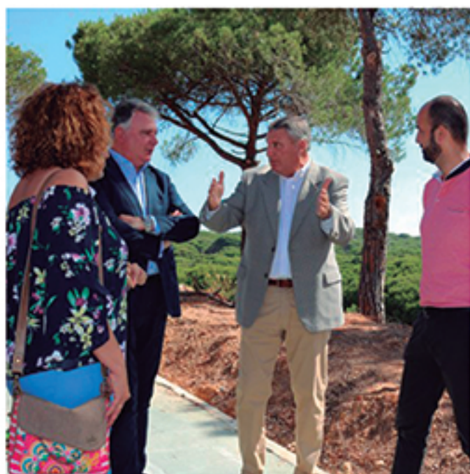
/ La colaboración entre administraciones, fórmula clave para la contratación de mano de obra.