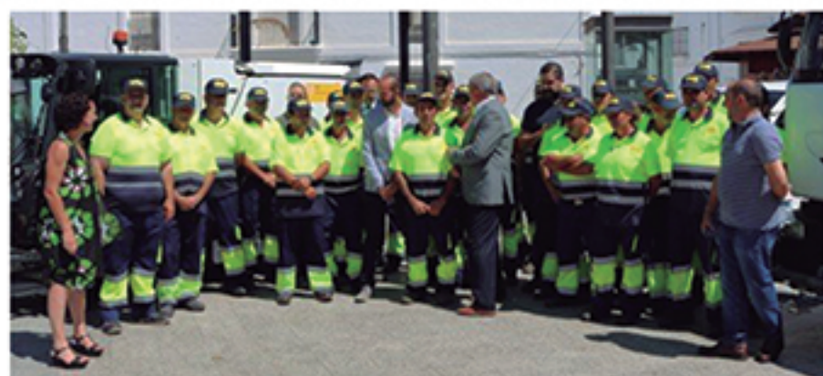
/ Inversión en limpieza que triplica el número de recursos materiales con la incorporación de más de veinte máquinas, y que duplica la plantilla pasando de 13 a 25 trabajadores.