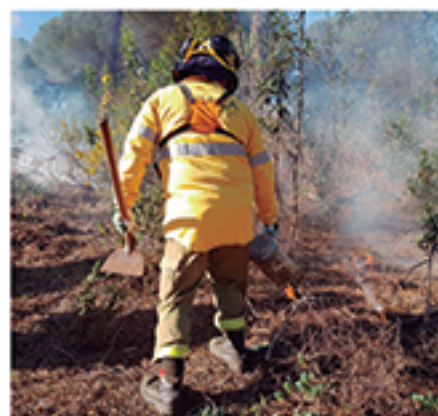
/ Con el INFOCA, acogiendo experiencias pioneras.