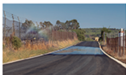
/ SAN FRANCISCO I