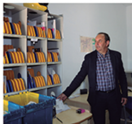
/ Nuevo servicio de Correos garantizado para los portileños.