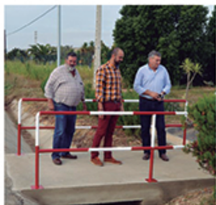
/ Cementerio: acceso peatonal, y más servicios al ciudadano.