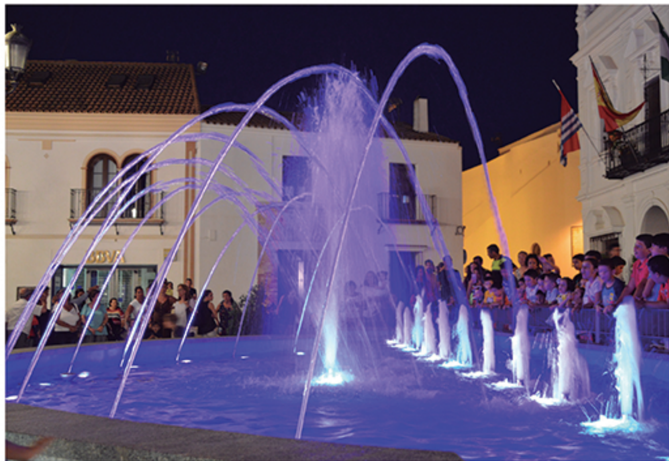
/ Rediseño y puesta en funcionamiento de la fuente de la Plaza Redonda.

El pasado reciente, consecuencia de una gestión socialista terrorífica , arrastraba una carga de deuda gigantesca que imposibilitaba por mandato estatal las inversiones . Encontramos fórmulas temporales para sortear la situación hasta que demostramos al Ministerio que éramos capaces de gestionar con responsabilidad . El Ministerio abrió la mano, y comenzamos a realizar importantes inversiones que Cartaya, El Rompido y Nuevo Portil necesitaban.