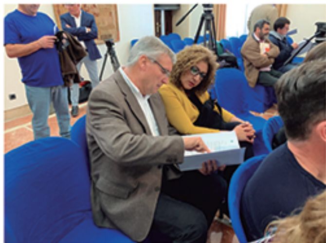
/ Búsqueda constante de fondos que financien las necesidades de obra pública.