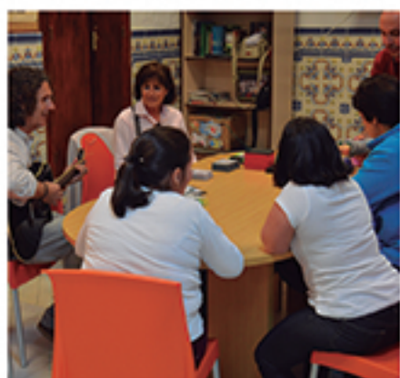
/ Musicoterapia, una actividad del CEDITER con grandes resultados.