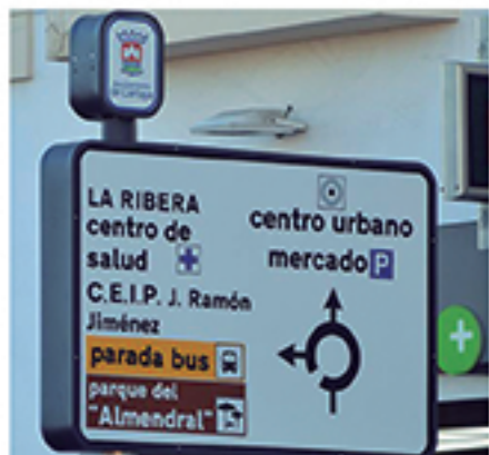
/ Renovación de la señalización vertical informativa de tráfico.