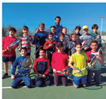
/ La escuela de tenis, una de las que más crece, doblando la participación.