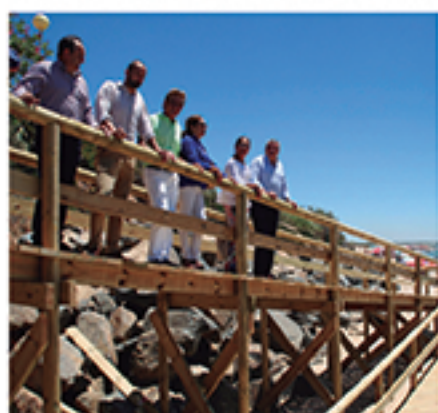
/ Construcción de accesos para personas con movilidad reducida.