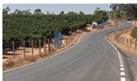
/ PUNTA DEL POZO