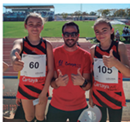
/ Atletismo, otra de las disciplinas que no para de cosechar éxitos.