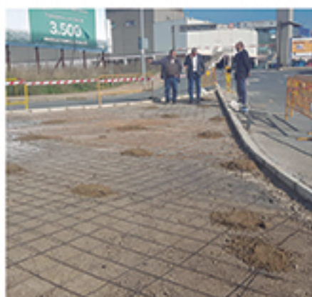
/ Isletas de acceso a carrefour y su rotonda que aporta seguridad.