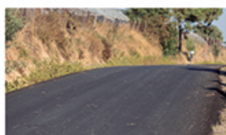
/ LOS BAYOS