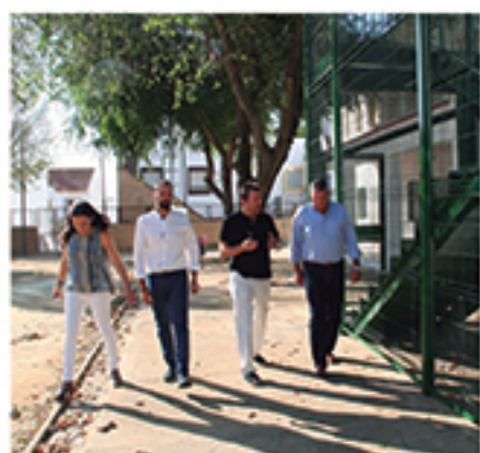
/ Construcciones como salidas de emergencia mejoraron los centros.

A pesar de que las competencias en Educación corresponden a la Junta de Andalucía, hemos complementado la labor docente con un amplio programa de mantenimiento de instalaciones, múltiples actividades de formación y prevención , iniciativas de sensibilización y otro apoyo como: información a la escolarización , traslado de las demandas ciudadanas al Consejo Escolar Municipal y el importante Plan Municipal de Absentismo Escolar .