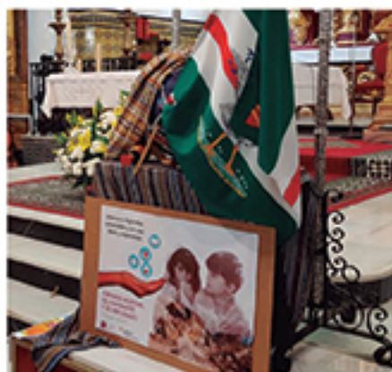
/ Celebramos la Jornada Mundial del Inmigrante y el Refugiado.