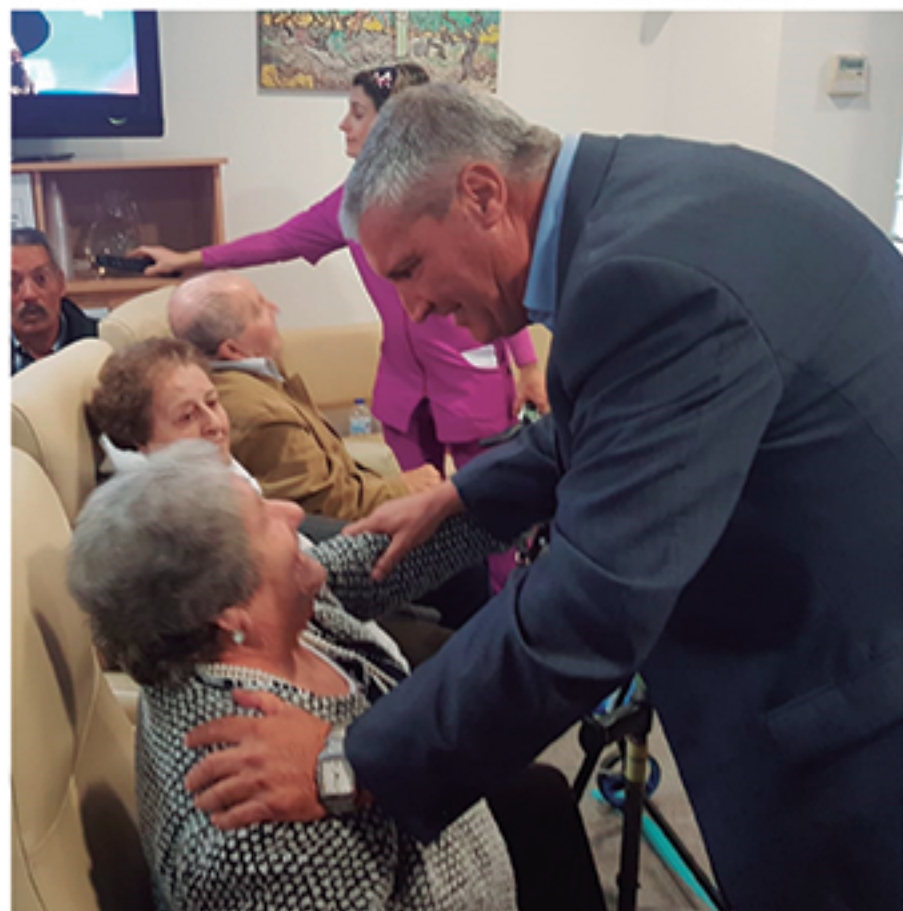
/ Con el Centro de Mayores y Dependientes de Cartaya, porque nunca podremos devolverles todo lo que los mayores hicieron por nosotros.