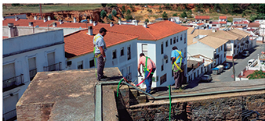
/ Dotamos al Castillo de los Zúñiga de muchas mejoras que permiten un uso regular: instalación eléctrica, aseos accesibles, barandillas, etc.