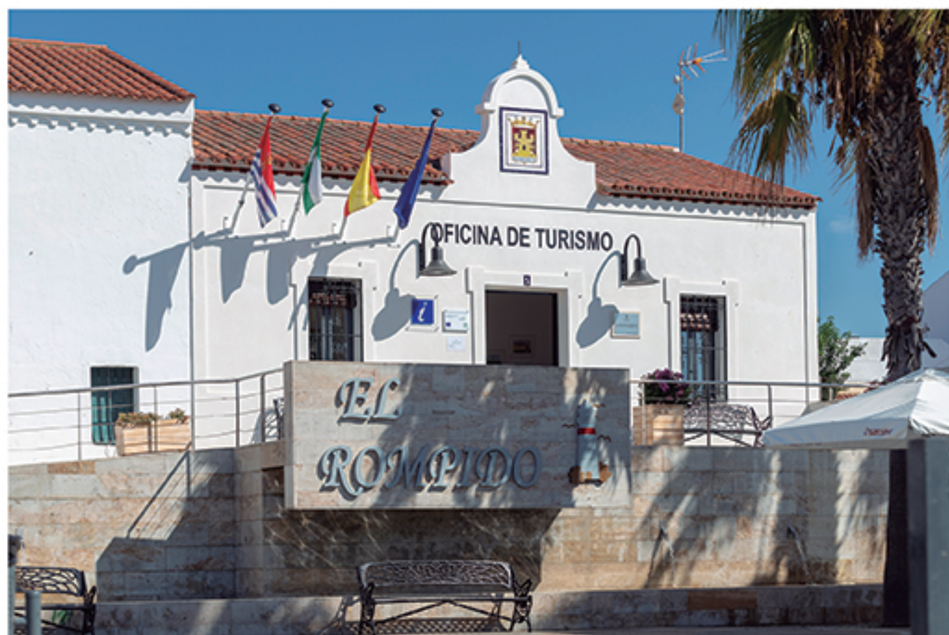
/ Fachada de la Oficina de Turismo en la Plaza de la Sirena, de El Rompido.

La apertura de la Oficina de Turismo en El Rompido ha supuesto un antes y un después en la prestación de servicios al turista, convirtiéndose en el centro neurálgico de la información municipal y atendiendo en el último año a más de 10.000 personas de 25 países .