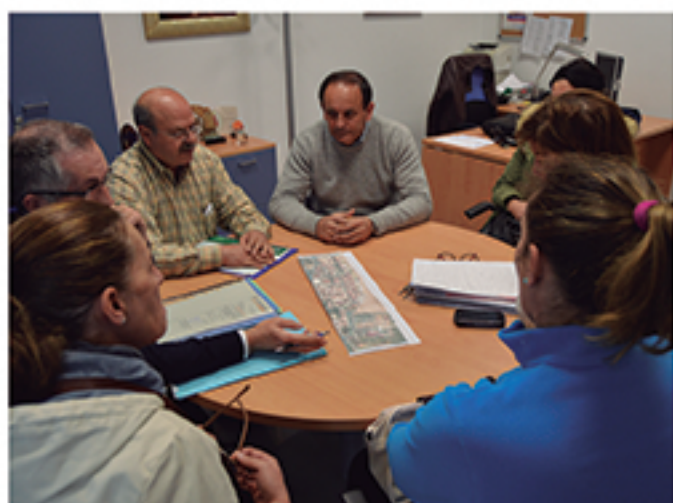
/ Diálogo permanente con el sector que ha permitido llegar a importantes consensos.