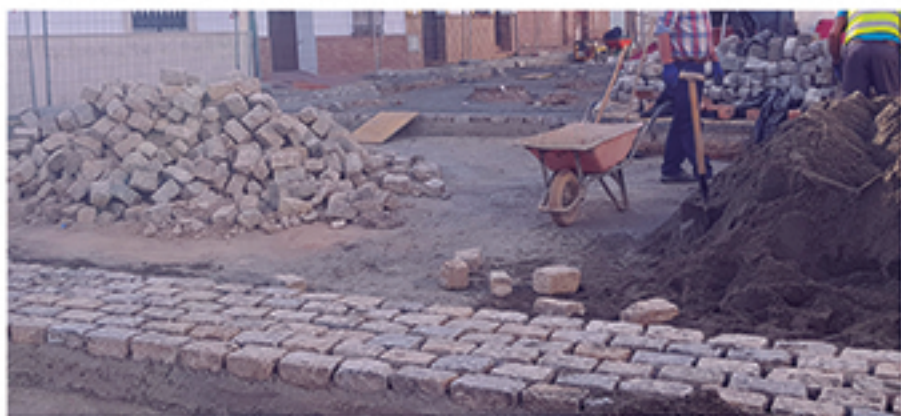
/ Obras de reurbanización de calles como Corral Concejo y Alta que han supuesto una importante mejora de la calidad de vida de sus vecinos.