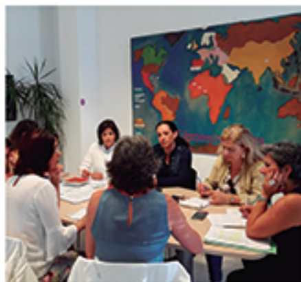
/ Comisión diseño de estrategia que resuelva problemas de JÓVENES .