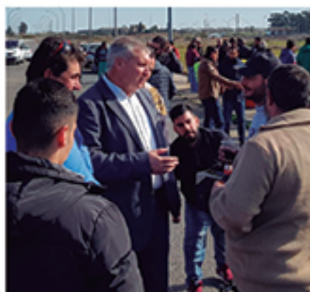
/ Con los aficionados al mundo del pájaro. silvestrismo.