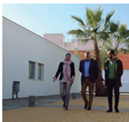
/ Obras de remodelación en el Centro de Mayores y Dependientes.