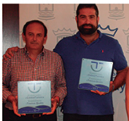
/ Certificación del Sistema Integral de Calidad Turística en Destino.