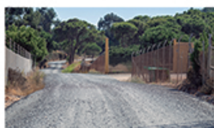
/ LOS TEJARES