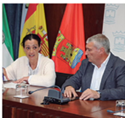
/ Monitores/as escolares , una prioridad en los Planes de Empleo.