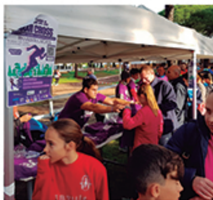
/ Vinculamos el Cross a la Lucha contra la Violencia de Género.