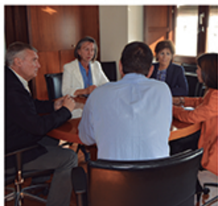
/ Firma del convenio Hacán-Doctor para la inclusión de jóvenes.