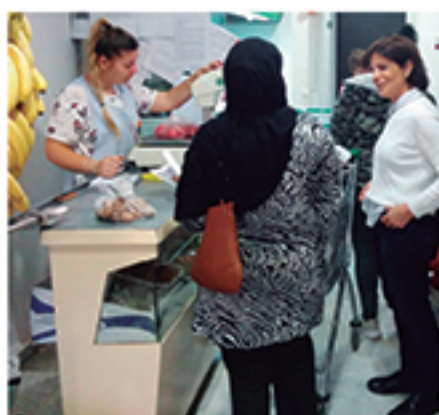
/ Acompañamiento en programas de garantía alimentaria.