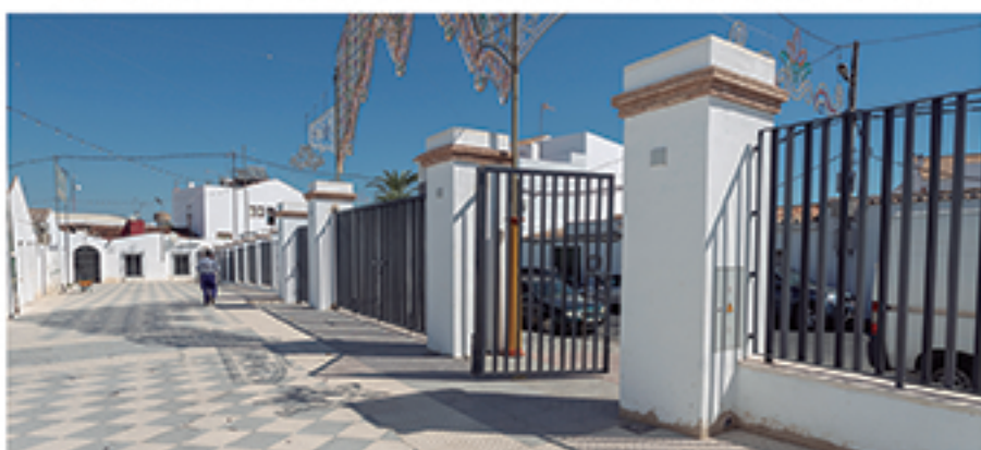
/ Realizamos importantes obras de mejora en el Recinto Ferial: cerramiento, asfaltado de calles, portada, solería, accesos, electricidad, etc.