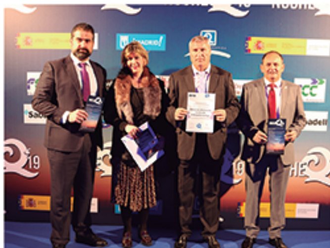
/ FITUR volvió a reconocer la enorme calidad experimentada por nuestro Turismo.