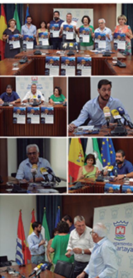
/ Con la Hermandad de Consolación en todo su amplio programa.