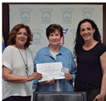
/ El concurso y su sorteo para elegir a la mascota del mercado, sirvieron para mejorar la asistencia a los puestos del mercado.

+8.000 atenciones DE ORIENTACIÓN E INTERMEDIACIÓN LABORAL Y ASESORAMIENTO A EM- PRENDEDORES