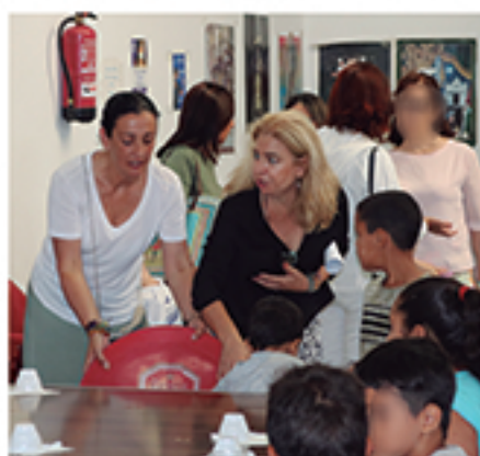
/ Máxima colaboración con iniciativas solidarias como el campamento