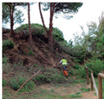
/ Intenso calendario de mantenimiento en los núcleos de playas.