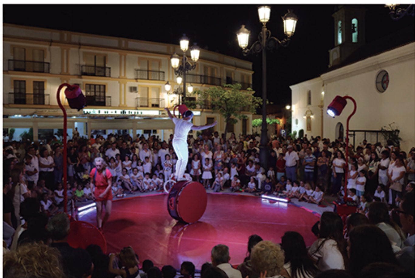
/ La Noche en Blanco se consolida como referente del verano cultural.

El éxito de la oferta cultural cartayera radica en la calidad y continuidad de la programación cultural que se desarrolla permanentemente y a los servicios culturales que ofertamos a la ciudadanía: siendo además un agente generador de economía para el municipio.