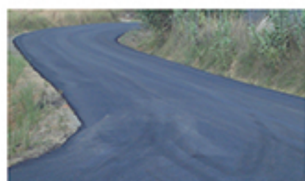
/ LA RAMIRA