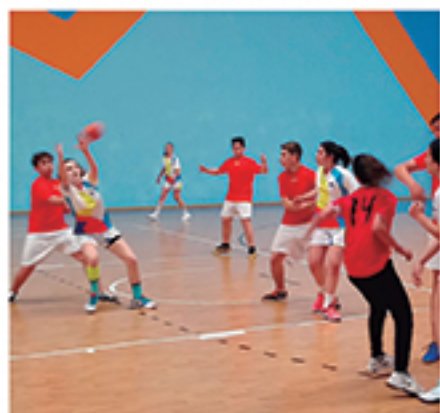
/ Balonmano, otra de las escuelas que sigue afianzándose.