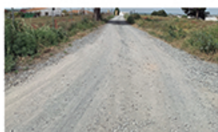
/ LOS REVENTONES