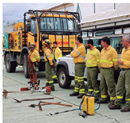
/ Estrecha colaboración con el INFOCA en prevención y educación.

+300 iniciativas DE EDUCACIÓN Y CONCIENCIACIÓN MEDIOAMBIENTAL REALIZADAS EN PLAYAS, MONTE, ESPACIOS NATURALES Y EN MATERIA DE RESIDUOS