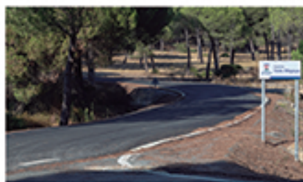
/ VALLE MOGAYA