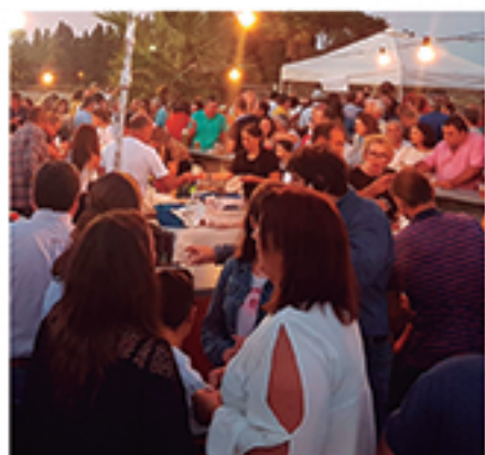
/ Con la Hermandad del Carmen en sus actividades, como el ronqueo.