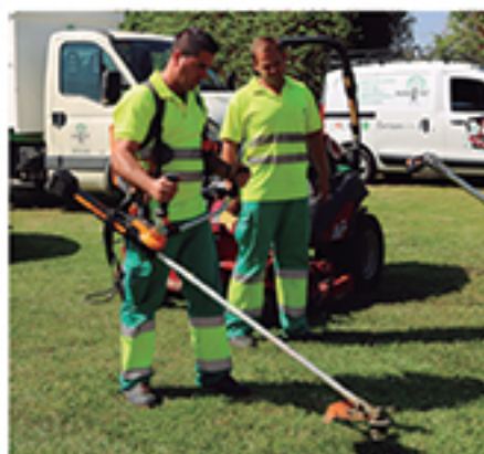
/ Inversión en jardinería con más de treinta máquinas nuevas, todas eléctricas o de gas licuado, y un importante aumento del personal.