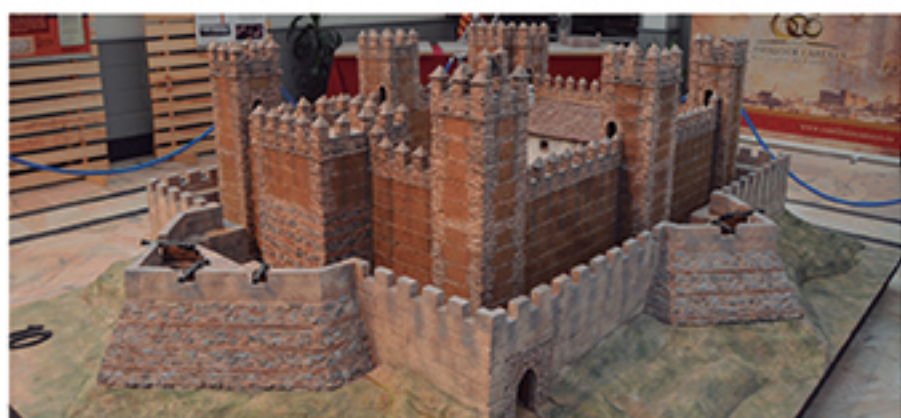
/ Programamos propuestas de altísima calidad que nos transportaron a la Cartaya de hace 6 siglos y que ocupó gran parte de la información provincial.