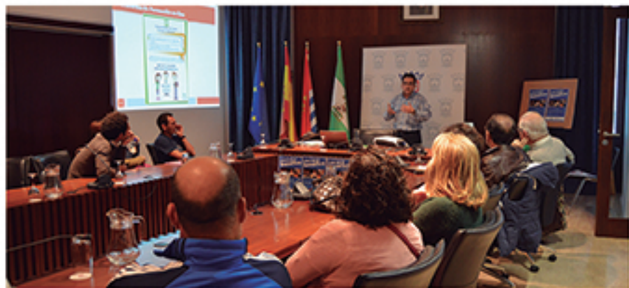
/ Iniciativas informativas y de asesoramiento sobre derechos de los consumidores, como en esta acerca de las cláusulas suelo de las hipotecas.