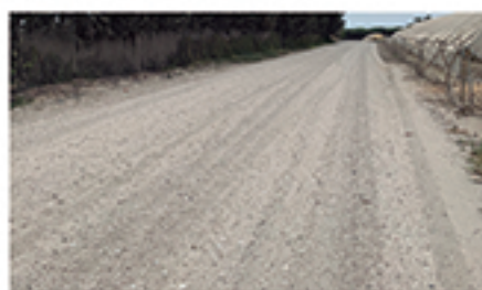
/ EL PUNTAL