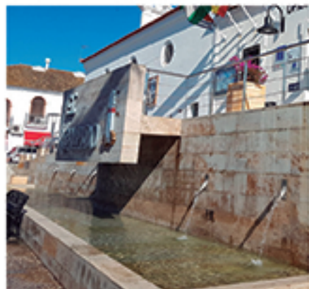
/ Restauración y puesta en funcionamiento fuente Plaza de la Sirena.