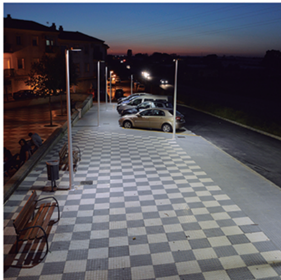
/ La obra de reurbanización de la Calle Naranjo ha resuelto un problema que se arrastraba desde hace décadas, dando salida al tráfico.