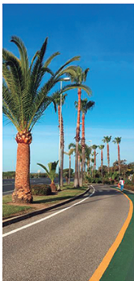
/ Planes de Poda periódicos por 1ª vez en los tres núcleos urbanos.