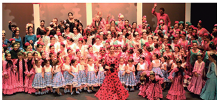
/ La Academia Municipal de Baile registra más de 250 alumnos al año de todas las edades llenando en cada una de sus actuaciones.