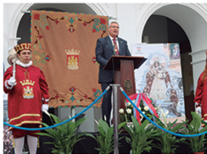
/ Novedades protocolarias para agilizar el inicio.