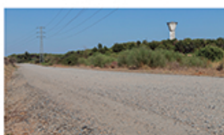
/ CAÑADA VELASCO