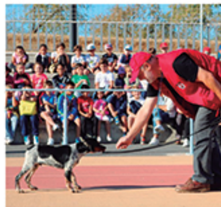
/ Propuestas de concienciación en el cuidado de los animales.