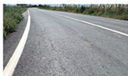
/ LAS AVEZANAS