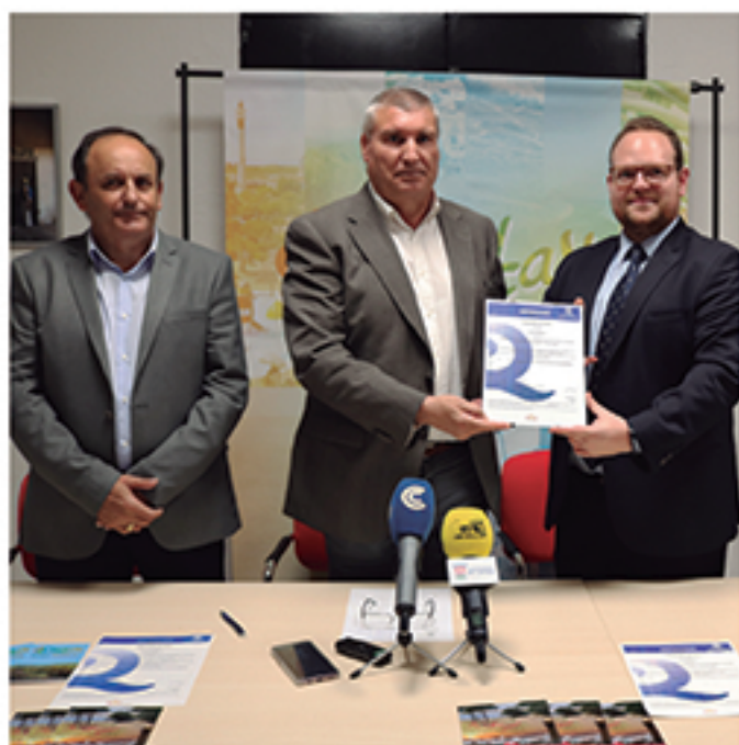
/ La Oficina de Turismo recibió la "Q" de calidad turística, una de las más prestigiosas.