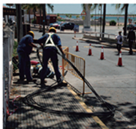
/ Múltiples obras de mejora de las infraestructuras de suministros.