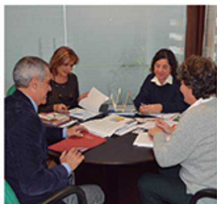
/ Divulgación y adhesión a programas de empleabilidad joven.

PARA LA GESTIÓN DE LAS DISTINTAS PRESTACIONES, AYUDAS O BONOS QUE ESTÁN DISPONIBLES