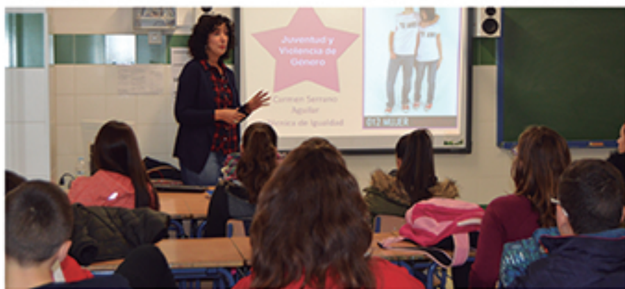
/ Las acciones formativas sobre prevención de la violencia de género han sido una constante.