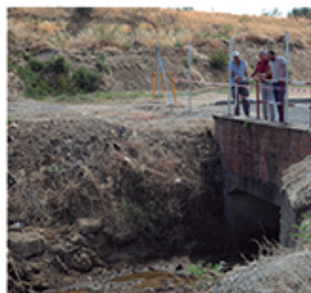
/ Limpieza de múltiples arroyos para evitar inundaciones de fincas .