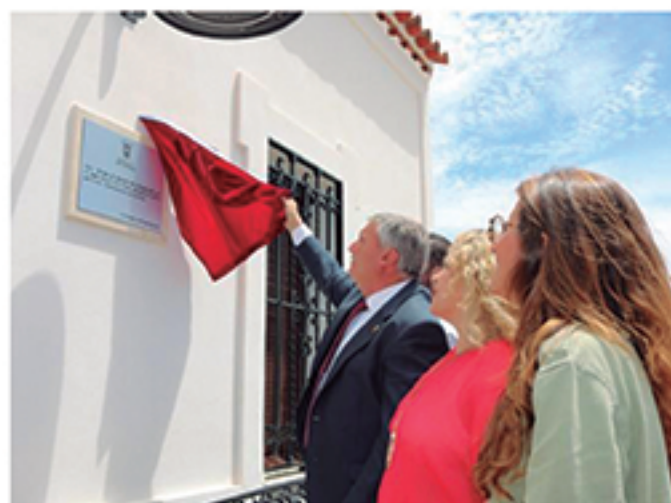
/ El alcalde en la inauguración.