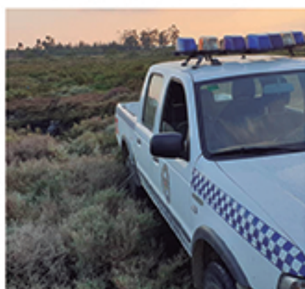
/ Operaciones de rescate.