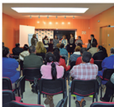
/ Talleres de inclusión para el fomento del empleo.