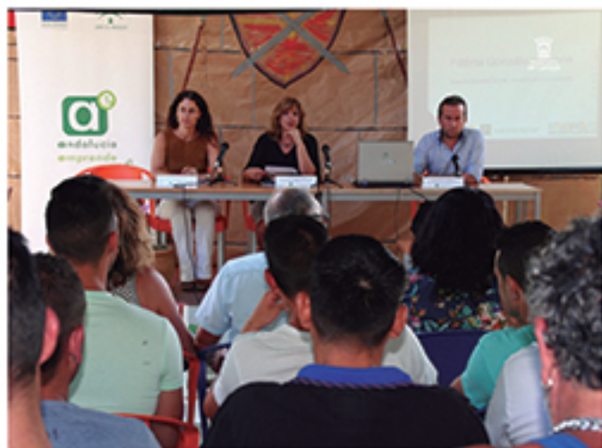
/ Estrecha colaboración con los agentes del entorno para fomentar y favorecer el autoempleo.