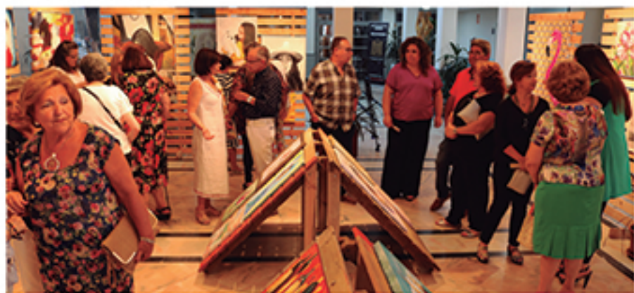
/ La Academia Municipal de Pintura sigue llenando de talento los espacios municipales.

+15% alumnos LAS ACADEMIAS MUNICIPALES SIGUEN CRECIENDO GRACIAS A LA CALIDAD DE LA OFERTA