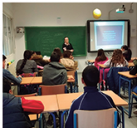
/ Educación en los estereotipos de género como medida de prevención.