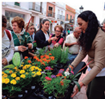
/ Celebración del Día Mundial del Medio Ambiente .