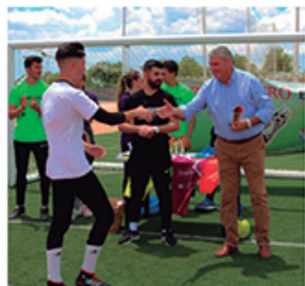
/ Tono de porteros, otra de las novedades acogidas en Cartaya.