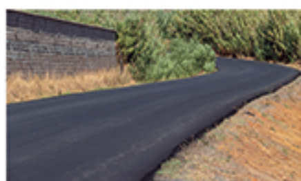
/ LAS CABEZUELAS