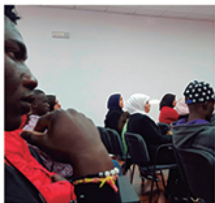
/ Divulgación de buenas prácticas para la integración