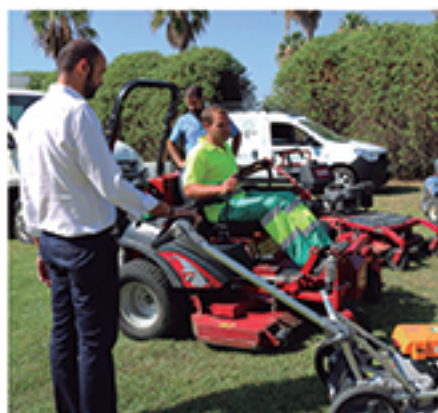
/ Primera localidad de la provincia en invertir en maquinaria eléctrica .

+300 iniciativas DE EDUCACIÓN Y CONCIENCIACIÓN MEDIOAMBIENTAL REALIZADAS EN PLAYAS, MONTE, ESPACIOS NATURALES Y EN MATERIA DE RESIDUOS