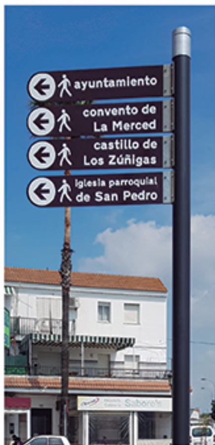
/ Señalización turística peatonal por primera vez en todo el término.