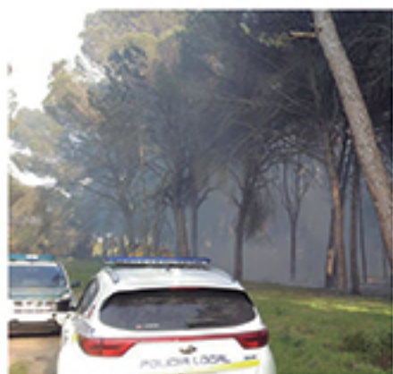
/ Intervenciones de "primer minuto" en incendios forestales y urbanos.