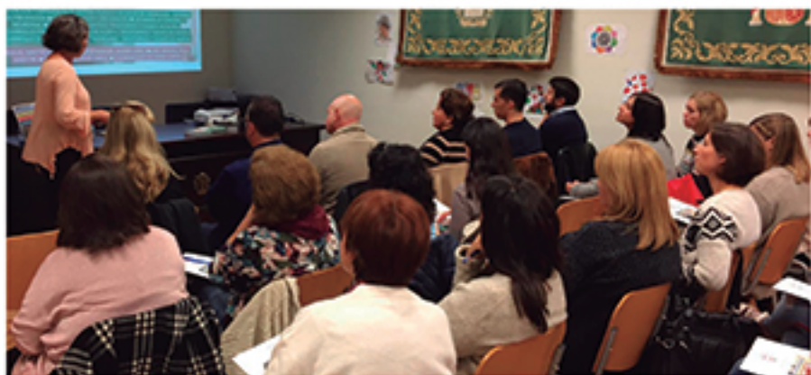
/ Prevención a través de actualización de conocimientos, como en estas charlas formativas para profesionales de escuelas infantiles.