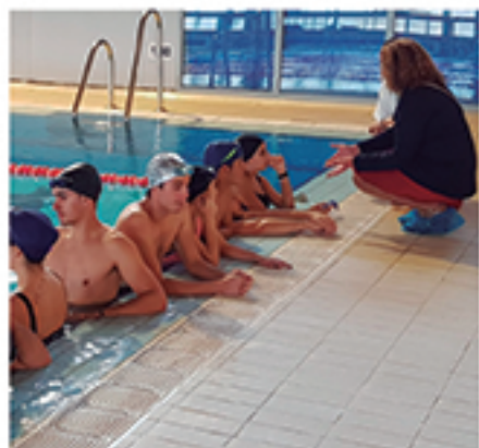
/ Más acciones formativas para una inserción laboral rápida.

DE EMPLEO DE EMPRESAS PRIVADAS GESTIONADAS Y PLANES PÚBLICOS DE EMPLEO