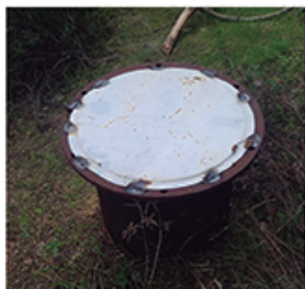
/ Realizamos una campaña de revisión y sellado de pozos ilegales .

El esfuerzo realizado en este área se ha intensificado debido al completo abandono al que sometió la Junta de Andalucía socialista a nuestra localidad . Competencias tan claras como la limpieza de arroyos y regajos o los tratamientos contra la procesionaria, tuvieron que ser realizados por el Ayuntamiento por el peligro evidente que corría la población. Además centramos los esfuerzos en limpiar el monte, concienciar y sensibilizar a la población.