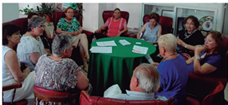
/ Se programaron numerosas actividades dirigidas a los mayores, como este Taller de Lectura.