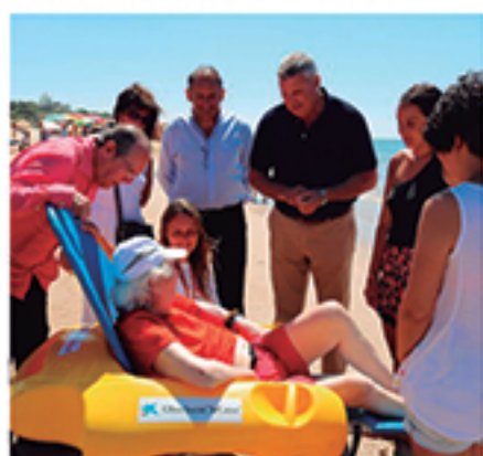
/ Más recursos con playas más accesibles para todos los ciudadanos.