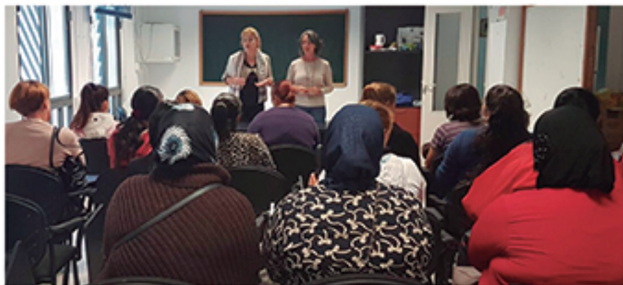
/ Charlas formativas sobre la sexualidad de la mujer, para colectivos en riesgo de exclusión social.