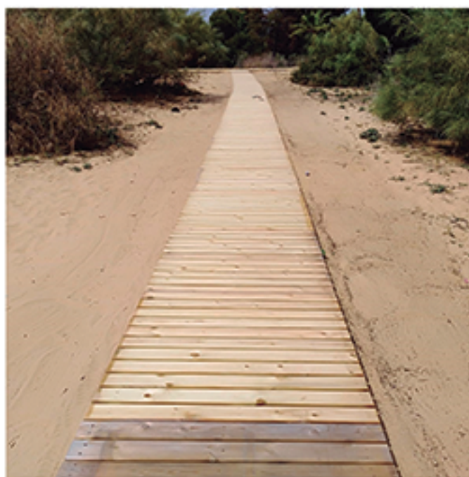
/ Renovación de todos los accesos a las playas e instalación de nuevos recursos.