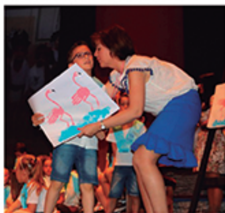
/ Dimos soporte a todos los centros escolares para sus graduaciones .