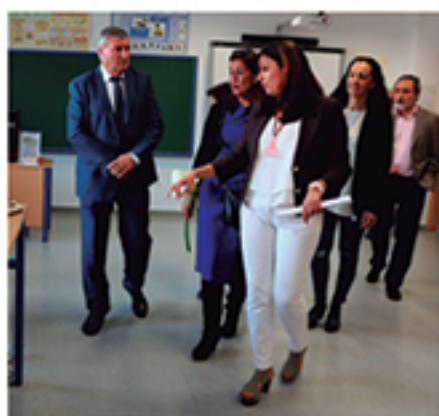
/ En el 50 Aniversario del IES Rafael Reyes.