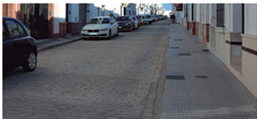
/ Obra de reurbanización de la C/Santa María: sustitución de pavimento, renovación de alcantarillado y acometidas de saneamiento a viviendas.