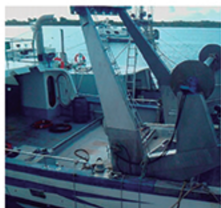
/ Participamos en la estrategia de captación de fondos para la pesca.