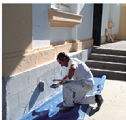
/ Tareas de mantenimiento que se multiplicaron a lo largo de los años.