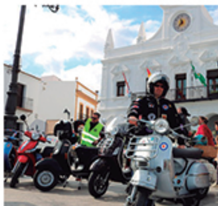
/ Durante todo un año Cartaya se convirtió en un escenario donde se sucedían centenares de actividades centradas en el Castillo de los Zúñiga: visitas guiadas, jornadas de historia, eventos solidarios, propuestas educativas, una larga lista de conciertos, tapas temáticas y hasta un encuentro vespero.