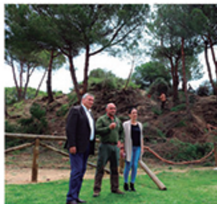
/ Limpieza y acondicionamiento del pinar, dentro del Plan de Prevención.