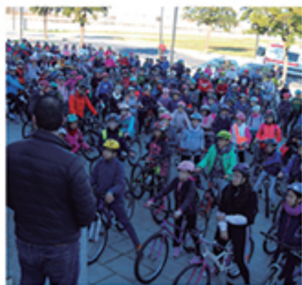
/ En el Día Escolar de la Bicicleta reunimos a más de 400 alumnos.