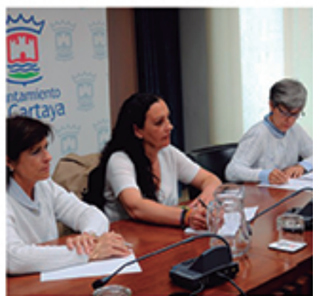
/ Comisión Contra el Absentismo Escolar , eje social por la Educación.