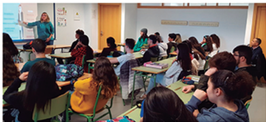
/ Talleres dirigidos a alumnos de la enseñanza secundaria sobre igualdad, amor romántico, relaciones saludables y prevención de la violencia .

Los Servicios Sociales son fundamentales en Cartaya, puesto que informan, asesoran, tramitan y resuelven una cantidad innumerable de problemas relacionados con el bienestar social. Hemos aumentado su presupuesto y nos hemos volcado en la programación de multitud de iniciativas. Podemos decir que la situación está mucho mejor que hace cuatro años pero seguimos aportando recursos para que no haya ni una sola persona que lo necesite.