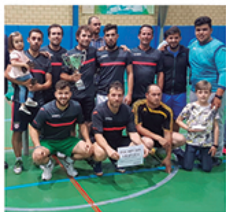
/ Fútbol Sala y Fútbol 7, dos de los torneos con más solera de Cartaya.