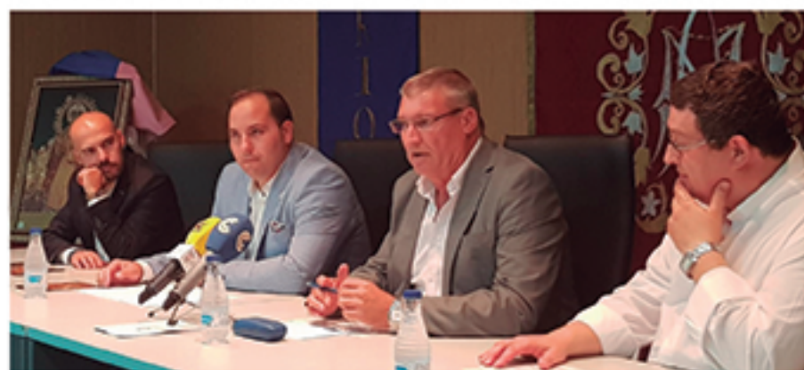
/ Con todos los actos de la Hermandad de Ntra. Sra. del Rosario -Patrona de Cartaya-