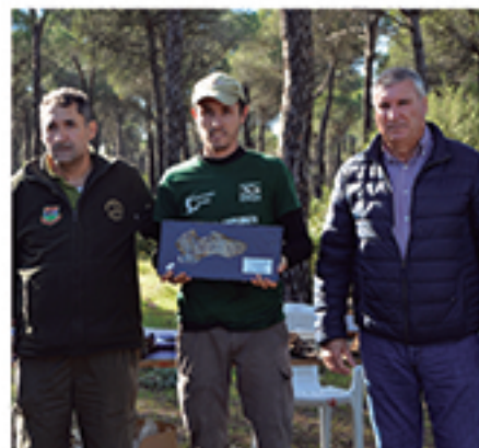
/ Con la Sociedad de Cazadores, quienes más respetan el monte.