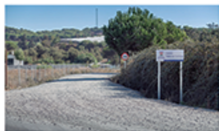
/ VALLE LAS CARRETAS