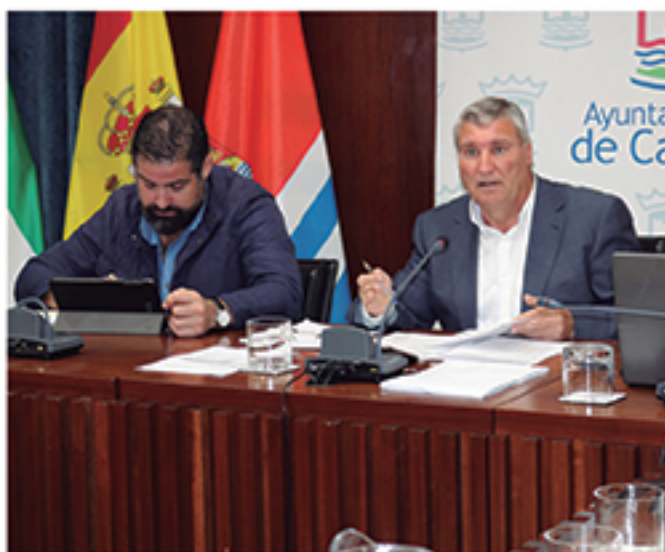
/ Momento en el que se anunciaba la rebaja de los impuestos a las personas con menos recursos.

Modificación de ordenanzas, reordenación de préstamos, operaciones financieras inteligentes, la adopción de la Administración Electrónica, o las negociaciones con el Gobierno Central son sólo algunas de las medidas que han permitido generar un millón de euros al año de superávit, que se ha usado para reducir deuda socialista y para realizar inversiones .