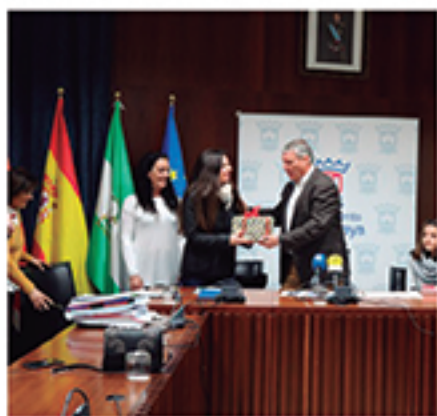
/ Mujer y Andalucía centraron una propuesta con 150 participantes.