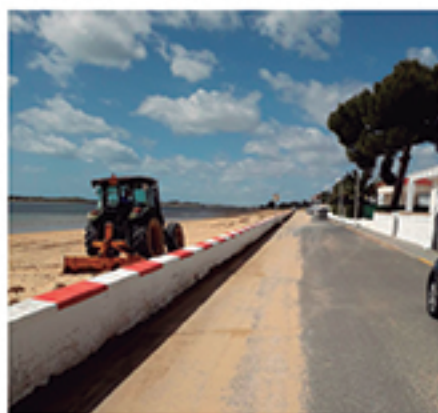
/ Planes de Playas ejecutados antes del inicio de cada temporada.