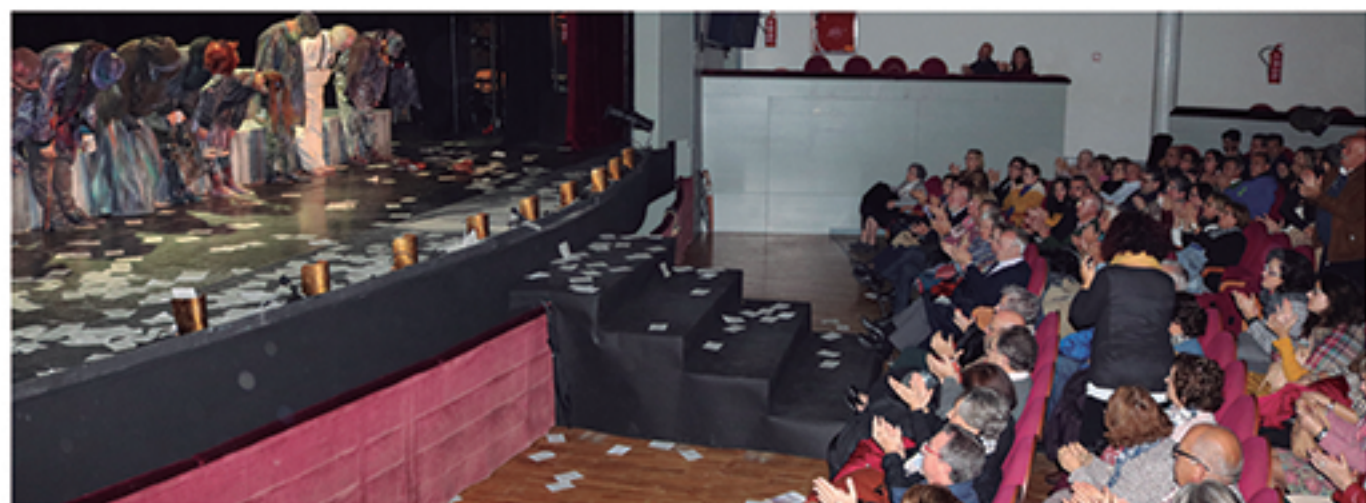
/ El Ciclo de Teatro de Otoño sigue impresionando a la provincia por la calidad de sus propuestas.