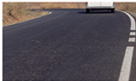
/ VIEJO ALJARAQUE