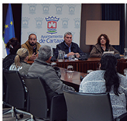
/ Resolución de dudas sobre contratos laborales.

+8.000 atenciones DE ORIENTACIÓN E INTERMEDIACIÓN LABORAL Y ASESORAMIENTO A EM- PRENDEDORES