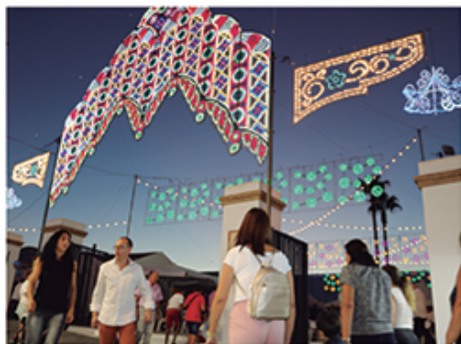
/ Multitud de mejoras en el recinto.