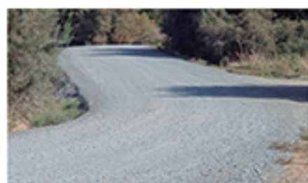
/ HUERTA LOS PINOS