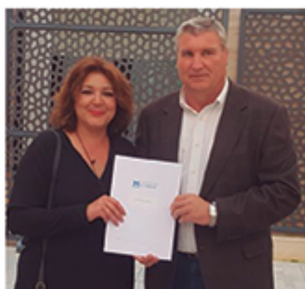
/ Planes de Concertación con la Diputación Provincial de Huelva.