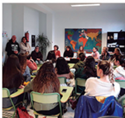
/ Divulgación de Servicios Sociales a alumnos del IES Rafael Reyes.

+10.000 atenciones DE SERVICIOS SOCIALES PARA LA ORIENTACIÓN, ASESORAMIENTO Y AYUDA.