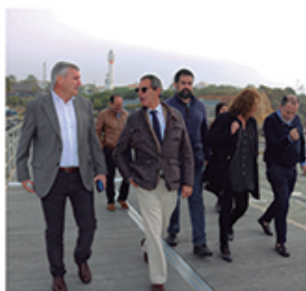
/ Exigimos mejoras a las administraciones competentes.