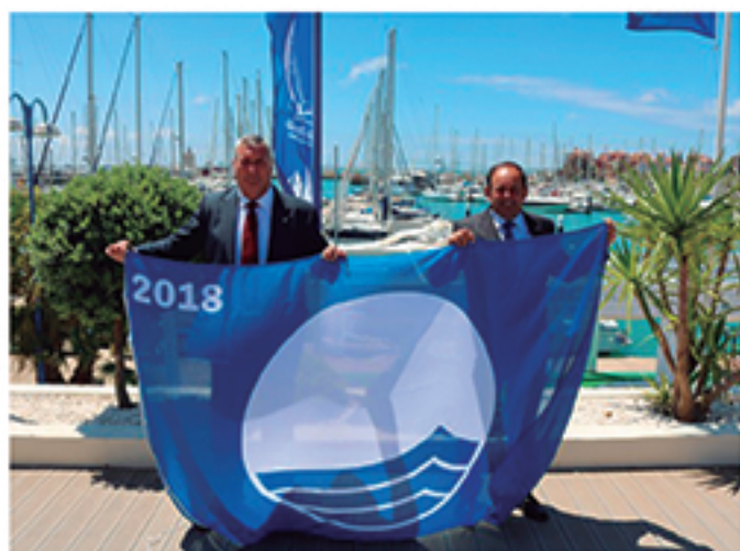
/ La Bandera Azul volvió a ondear en las Playas de Cartaya tras más de 20 años sin hacerlo.