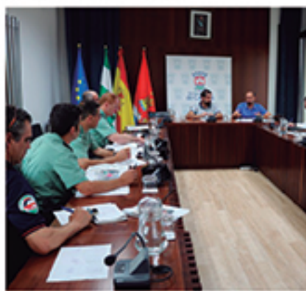
/ Dispositivos especiales de coordinación para grandes eventos.