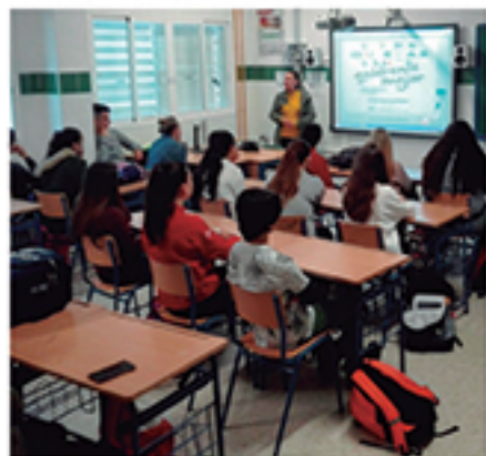
/ Promoción de relaciones sanas entre adolescentes de secundaria.