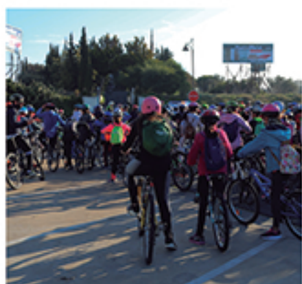
/ Día escolar de la bicicleta, una propuesta en educación deportiva.