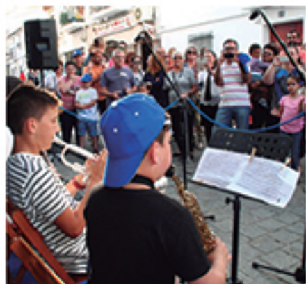
/ Acercamos las academias a todo el municipio programando salidas.