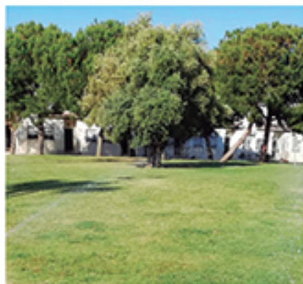
/ Una apuesta permanente por el cuidado y mantenimiento de los espacios públicos con centenares de actuaciones en Cartaya, El Rompido y Nuevo Portil.