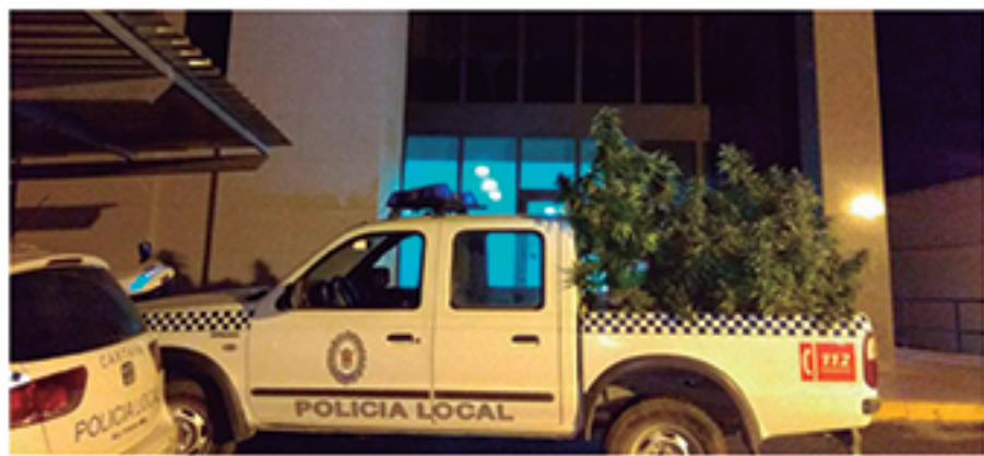
/ Múltiples operaciones exitosas contra la tenencia y distribución de drogas y otras sustancias ilegales.