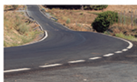
/ CAÑADA DEL CORCHO