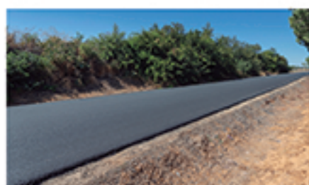
/ LA CODORNIZ