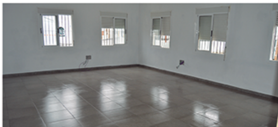
/ Construcción de un Centro de Formación Municipal homologado y completamente accesible que será una referencia en los próximos años.