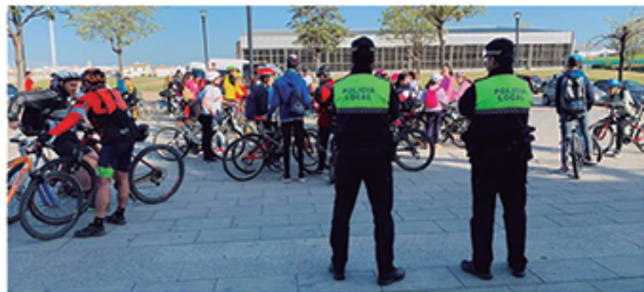
/ Acompañamiento para garantizar la seguridad de los menores que participan en actividades extraescolares.