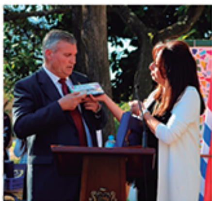
/ Celebramos el 50 Aniversario del IES Rafael Reyes.