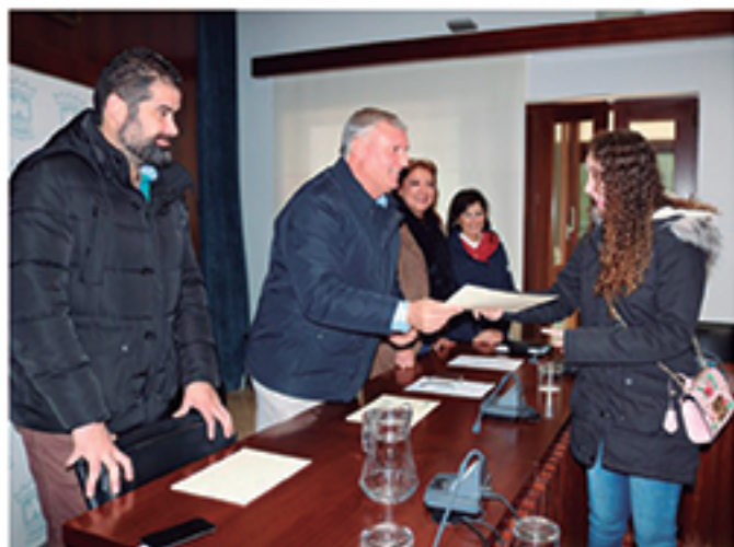
/ Entrega de Certificados de Experiencia Profesional a trabajadores de Plan de Empleo Joven.