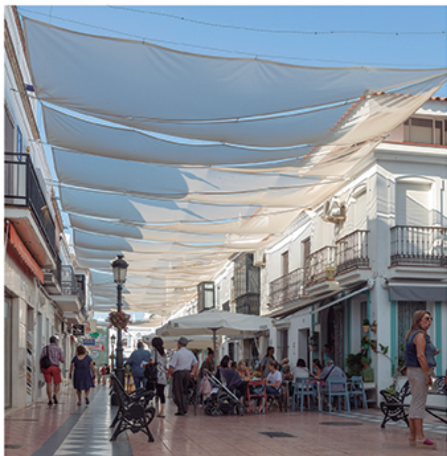
/ La obra de remodelación de la Plaza Larga y el entoldado han aportado un mejor tránsito, un espacio más confortable y un plus para los comercios.