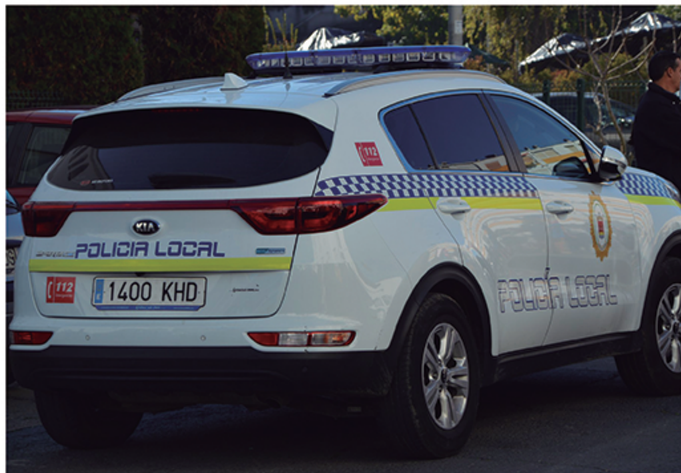
/ Uno de los vehículos adquiridos durante esta legislatura.

A pesar de la intensa campaña de desinformación diseñada por el PSOE con el dinero público que se inyecta en medios como HuelvaCosta.com, la Guardia Civil asegura que Cartaya está por debajo de todos los índices de criminalidad. Aún así, hemos aportado multitud de nuevos recursos que garanticen una prestación de servicios de seguridad con garantías.