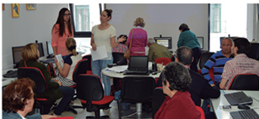
/ Información, asesoramiento y tramitación de inscripciones en el programa de turismo social para mayores.