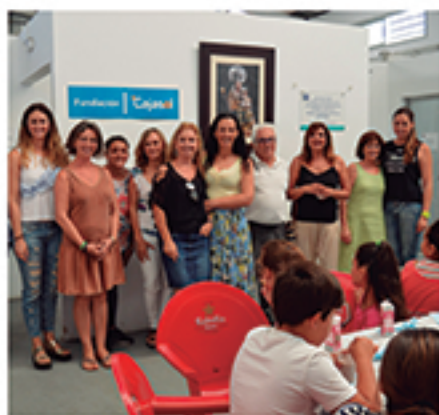
/ El Aula Socioeducativa trajo la soledad en forma de educación.