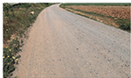
/ VALDEURIQUE ALTO