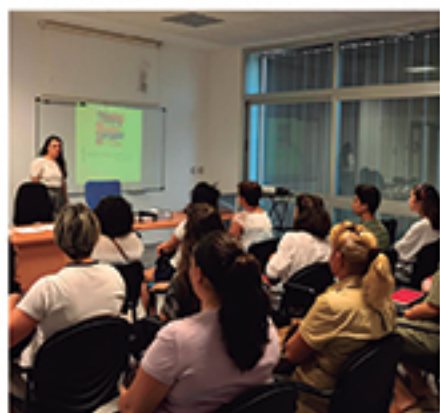
/ Cursos para perfiles con alta demanda en nuestro entorno.