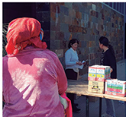
/ Entrega de recursos en el Programa de Ayuda Alimentaria.