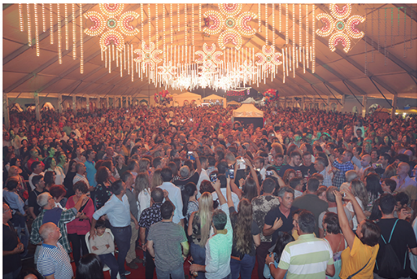
/ La Feria de Octubre de los últimos años está batiendo todos los récords de asistencia.

Las obras de remodelación del recinto ferial para la Feria de Octubre junto al impulso decidido por la mejora de la Feria del Caballo, Romería de San Isidro, Degustación de Mosto o Navidades han supuesto un rotundo éxito de participación con visitantes de toda España.