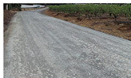
/ EL MONTE