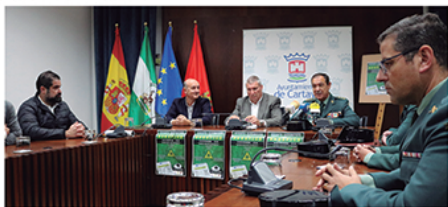
/ Propuestas solidarias que ayudan a conocer y acercar a la sociedad la labor de las Fuerzas y Cuerpos de Seguridad.