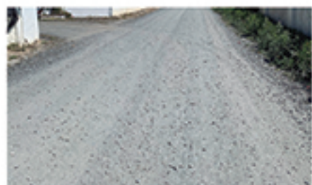
/ TINAJA - LA VASCA