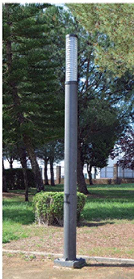
/ Renovación de luminarias por LED de bajo coste en los 3 núcleos.