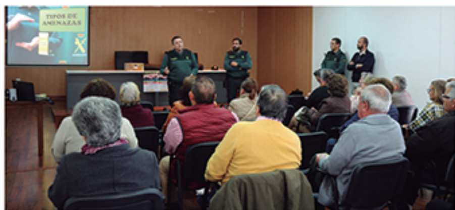
/ Charlas formativas en materia de prevención de delitos, una necesidad que aumenta la seguridad de los más vulnerables.