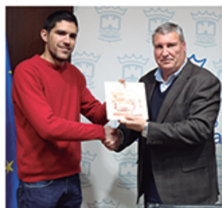
/ Reconocimiento a campeones cartayeros: rally.