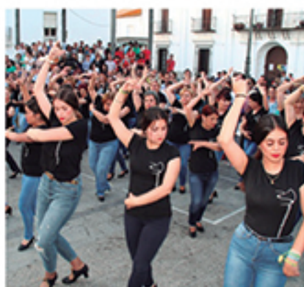
/ Siempre presentes en todas las propuestas multidisciplinarias.