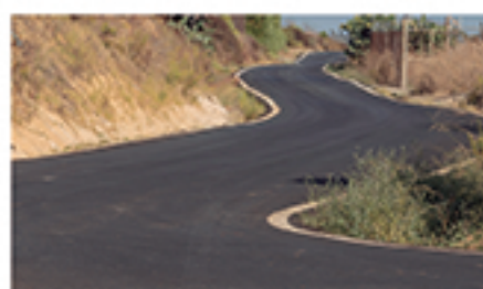
/ LA VASCA