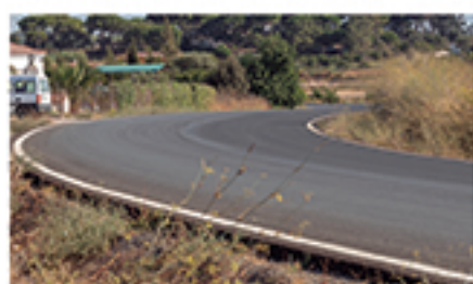
/ LA ROMERÍA