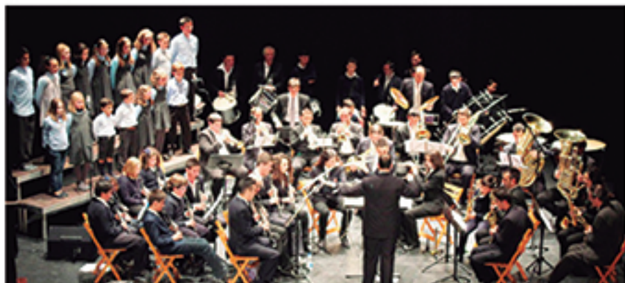
/ Aumenta un 40% el número de alumnos de la Academia Municipal de Música con unos resultados excelentes de participación.