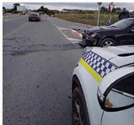
/ Colaboración entre unidades policiales en accidentes de tráfico.