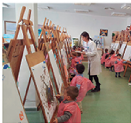
/ Desde muy pequeños se les da vía libre a su creatividad.