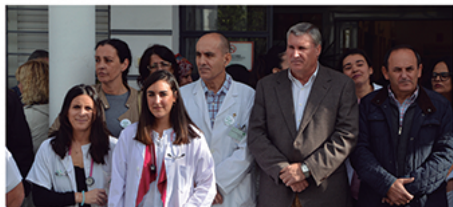
/ Con las reivindicaciones de los profesionales de la sanidad: por una atención sanitaria de calidad en Cartaya.