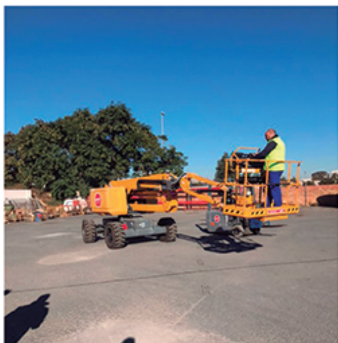
/ Cursos de calificación profesional ajustados a las demandas del entorno más cercano.