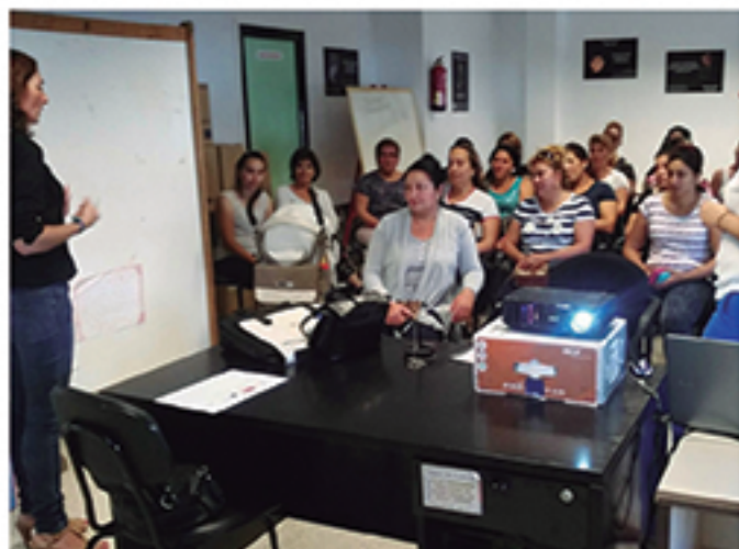
/ Charlas informativas para favorecer la inserción laboral de colectivos específicos.