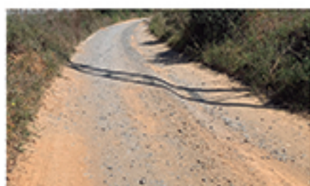
/ LA MATANZA