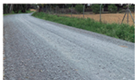
/ SAN BARTOLOMÉ