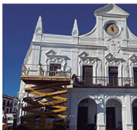
/ Plan de Embellecimiento de los edificios públicos.