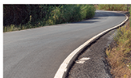
/ LAS VENDIOLAS