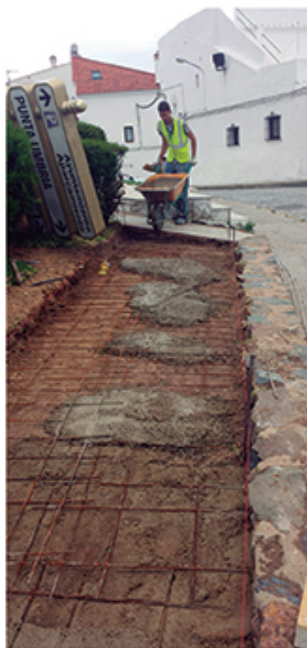
/ Medio centenar de actuaciones para dotar de más servicios al Castillo .