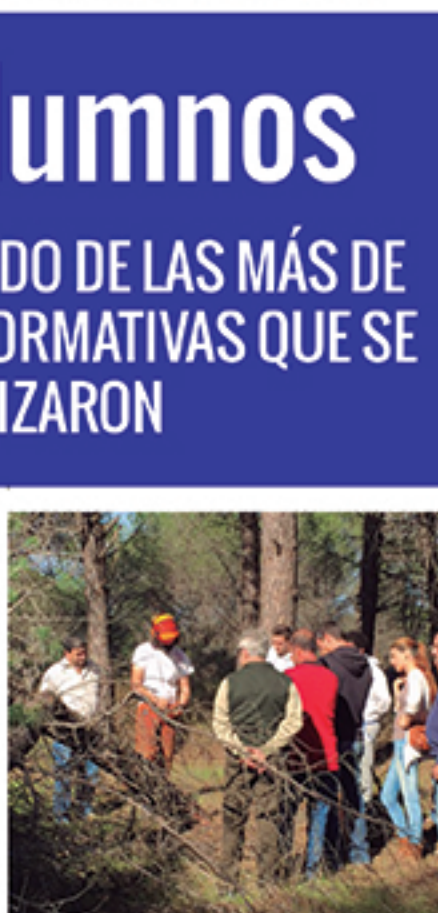
/ Carretillas elevadoras frontales, aplicación de productos fitosanitarios, motoserriesta o poda; fueron alguno de los cursos que proporcionaron una alta tasa de empleabilidad.

+500 alumnos SE HAN BENEFICIADO DE LAS MÁS DE 30 PROPUESTAS FORMATIVAS QUE SE ORGANIZARON