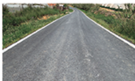
/ PILAR DE LA DEHESA