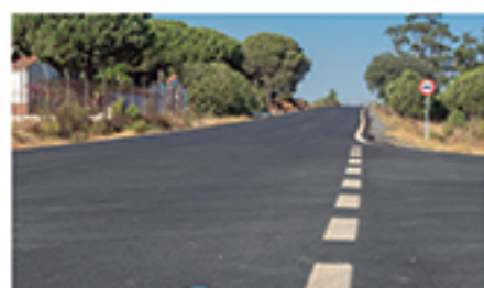
/ LA GUIJARROSA