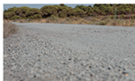
/ LA PUNTILLA