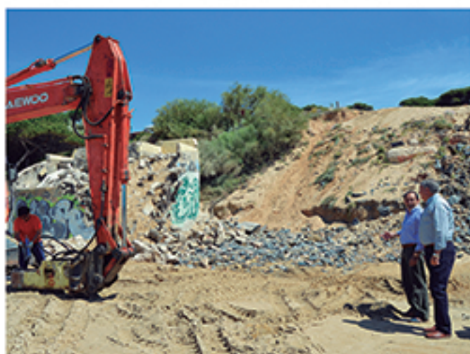
/ Resolución de problemas enquistados durante décadas.