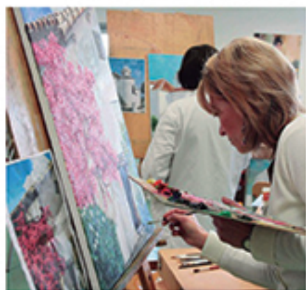
/ Una apuesta permanente por la formación en las artes.

+15% alumnos LAS ACADEMIAS MUNICIPALES SIGUEN CRECIENDO GRACIAS A LA CALIDAD DE LA OFERTA