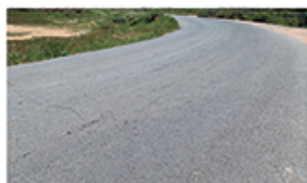
/ PRADO VIEJO