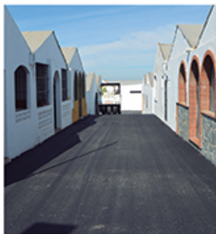
/ Pusimos en marcha un ambicioso Plan Municipal de Asfaltado, sin precedentes en nuestra localidad, que permitió dejar nuevas más de 60 calles de Cartaya, El Rompido y Nuevo Portil.