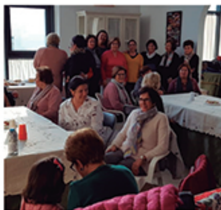
/ Concurso de repostería en el programa de la Semana de la Mujer .

+10.000 atenciones DE SERVICIOS SOCIALES PARA LA ORIENTACIÓN, ASESORAMIENTO Y AYUDA.