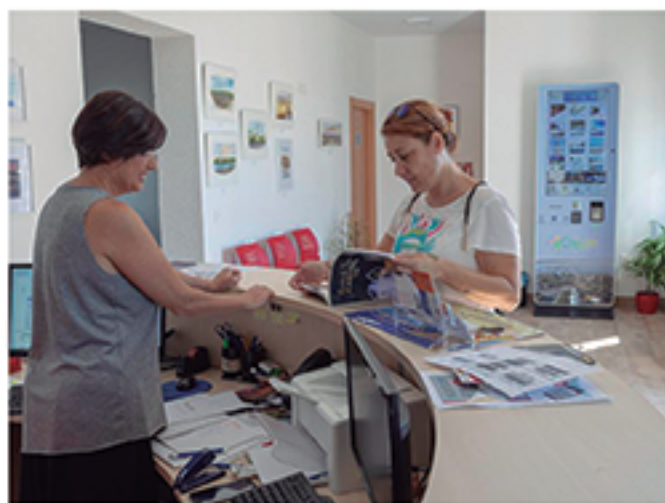
/ Folletos, tecnología y técnicos divulgan la oferta.