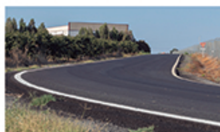
/ LA GOMA