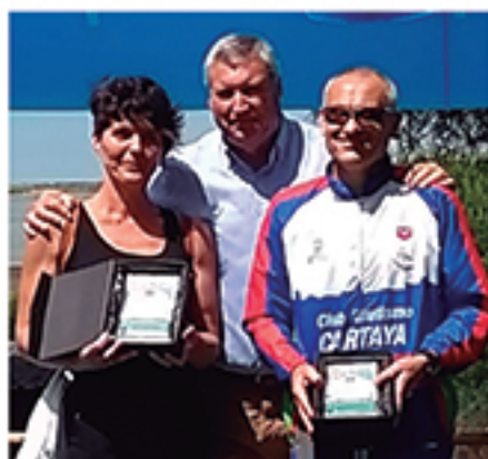
/ La Media Maratón se convierte en referencia provincial líder de atletas.