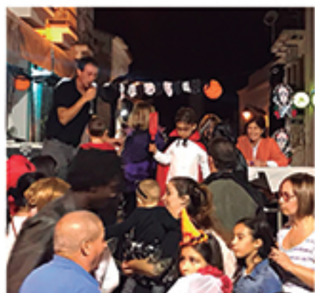
/ Se pusieron en marcha docenas de iniciativas para dinamizar los espacios comerciales de la localidad.