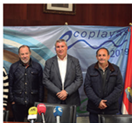
/ Reconocimiento a la calidad medioambiental y turística de playas.