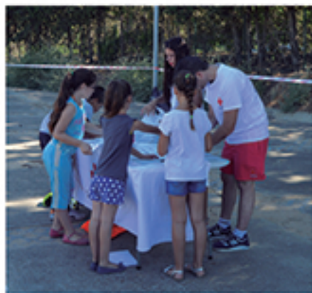
/ Docenas de colaboraciones con Cruz Roja, como el verano social.