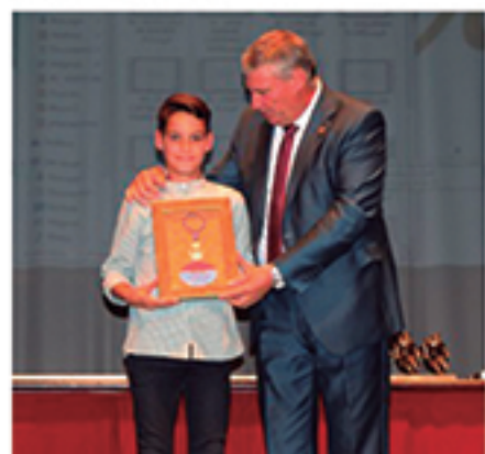
/ Celebramos la Gala del Deporte para recordar todos los éxitos.