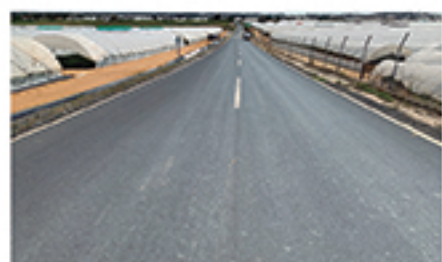
/ NUEVO VALDEFLORES