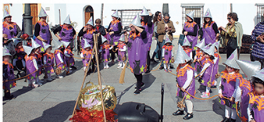
/ Con las guarderías y todos los demás centros educativos de Cartaya, El Rompido y Nuevo Portil.