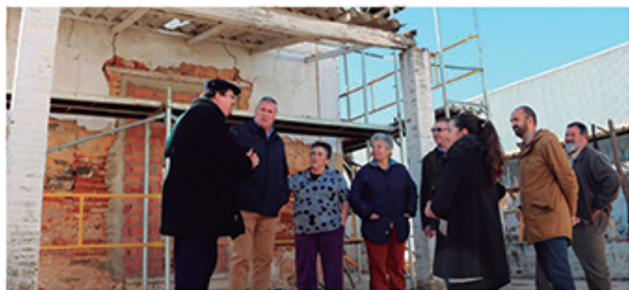
/ Colaboración con la parroquia y los vecinos para la restauración de la Ermita de la Cruz de los Milagros.