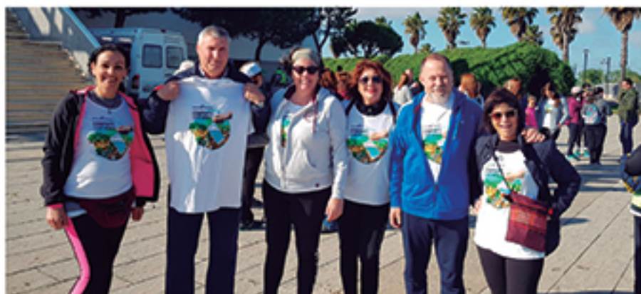
/ Con todas las ONGs que nos lo solicitaron, como Manos Unidas en varias ocasiones.