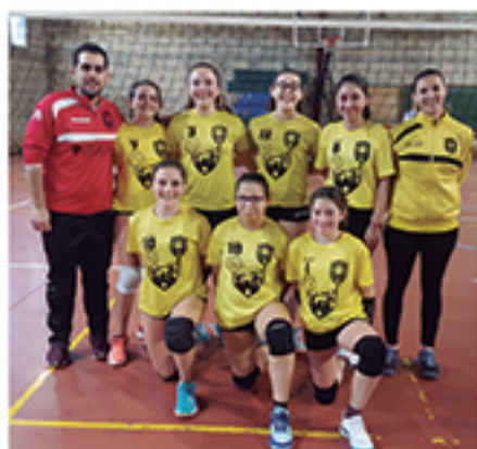
/ Continua creciendo tanto la escuela como los logros del Voleibol.