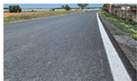
/ PINILLO BAJO